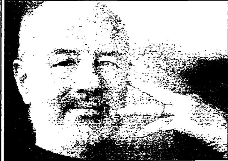
مرwan قصاب باشي

اما بالنسبة للتعميم الذي اصدرته. والحديث للوزير. وهو بخصوص النشاطات الثقافية التي تقوم بها الهيئات الثقافية والتي تلخص بان وزارة الثقافة ليست علامة محايدة في صنع الثقافة وواقعيتها كما ورد في رسائلها.